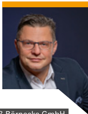
Sven Schulze Kinder- und Jugendhilfzentrum Groß Börnecke GmbH Groß Börnecke

„Vernetzt, Lösungsorientiert, Rechtssicher: Gemeinsam meistern wir mit inspirierenden Unternehmern die Herausforderungen der Zukunft. Dank erstklassiger arbeitsrechtlicher Beratung des Verbands sichern wir unsere Arbeitsbeziehungen - für eine starke Wirtschaft in Sachsen-Anhalt.“